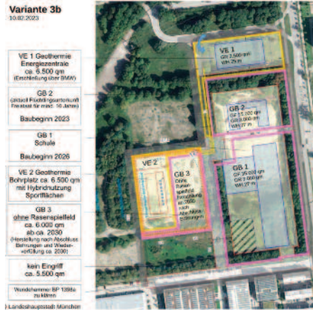
Eine der aktuellen Planvarianten für die Bebauung, auf der ursprünglich viel mehr grüne Ausgleichsfläche vorgesehen war. Rechts im Plan die Schleißheimer Straße.

Oberbürgermeister Dieter Reiter bringt es auf den Punkt: „Das eine Referat möchte gern Gewerbe, das andere eine Schule, das dritte eine Geothermieanlage. Der Landesbund für Vogelschutz will keinerlei Bebauung, weil dort Vögel leben.“ Und trotz des angenommenen Bürgerbegehrens Grünflächen-Erhalt scheinen Grünflächen in München immer noch einen sehr geringen Stellenwert zu haben. Der Stadtrat sah auf seiner Vollversammlung am 17. Mai noch Klärungsbedarf und vertagte das Thema.