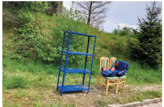
Vorher und nachher: Fast alles, was in der Thaddäus-Robl-Straße rausgestellt wurde, fand neue Liebhaber