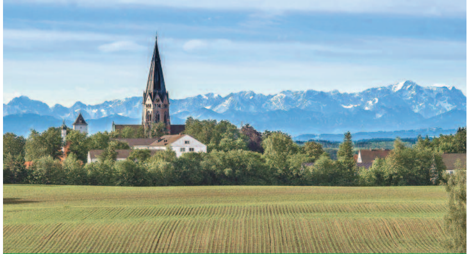
Klosterkirche St. Ottilien

Gegen 12.00 Uhr ist Weiterfahrt nach Dießen am Ammersee. Dort erwartet die