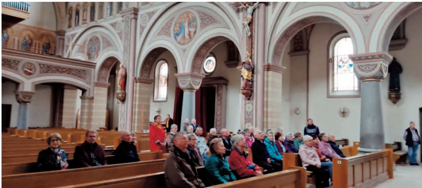
In der Pfarrkirche St. Bartholomäus