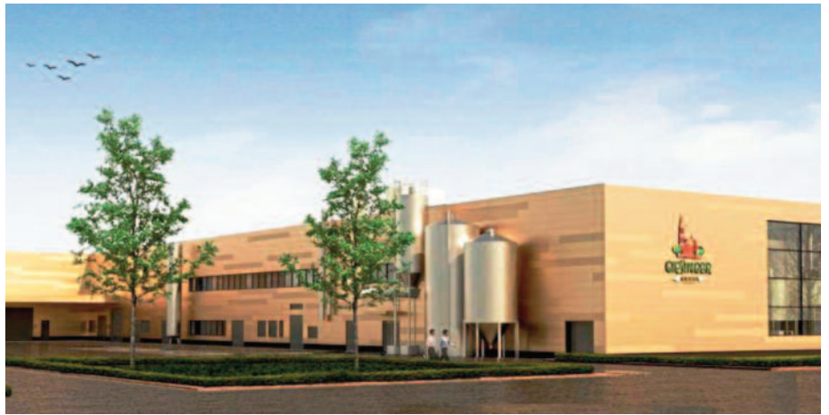
An der Detmoldstraße entsteht ein Produktionsgebäude für die Giesinger Brauerei

Erschließungssituation ist nun die Möglichkeit einer Ansiedlung von Gewerbebetrieben gegeben. Dem Wunsch, das Gebiet aus dem Maßnahmenkonzept herauszunehmen, kann daher nicht entsprochen werden.“